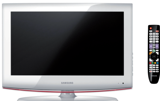
LCD-TV met hospitality afstandsbediening