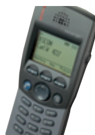
9d24 Messenger messaging/paging telefoonfunctie