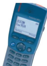
9d24 MK II ATEX Explosieveilige uitvoering messaging/paging telefoonfunctie persoonsbeveiliging