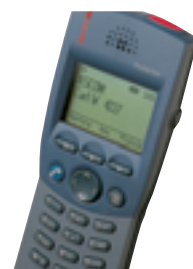
9d24 Protector messaging/paging telefoonfunctie persoonsbeveiliging

De beschikbare functies zijn afhankelijk van het type handset en variëren van standaard telefonie tot geavanceerd berichtenverkeer en persoonlijke alarmering. Via locatiebepaling is hierbij exact vast te stellen vanaf welk basisstation het alarm is verzonden. Ook ondersteuning van e-mail, webbrowser of standaard seriële protocollen is mogelijk. Voor toepassing in omgevingen waar sprake is van explosiegevaar zijn intrinsiekveilige (EX) uitvoeringen leverbaar van zowel handsets als basisstations.